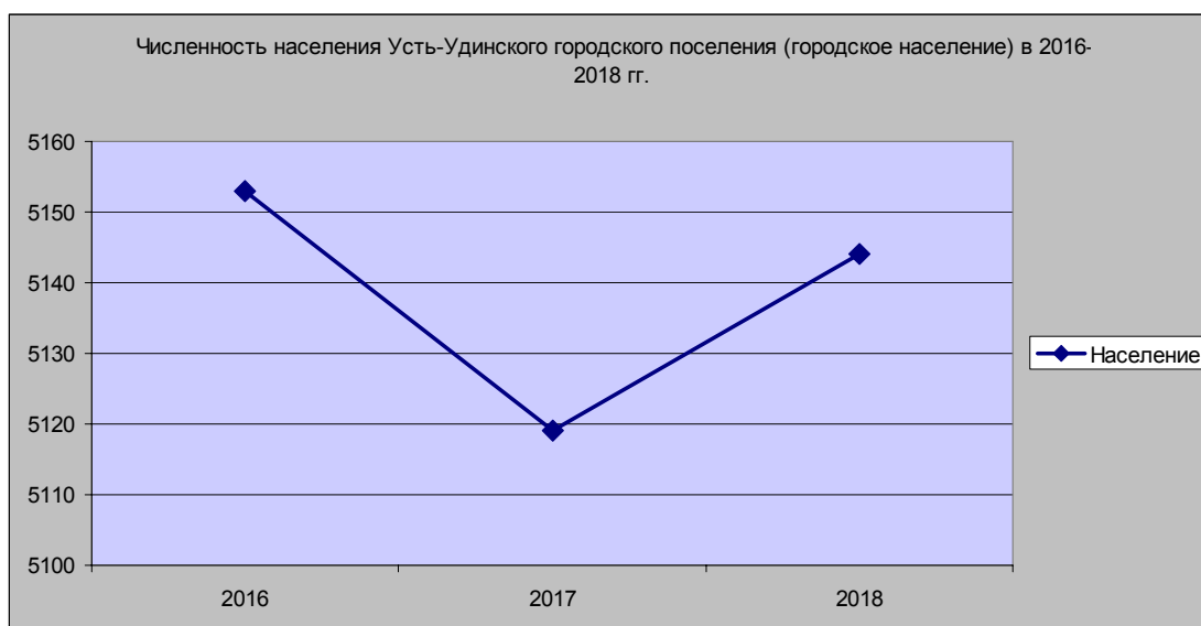
График 1. Численность населения Усть-Удинского городского поселения (городское население) в 2016-2018 гг.

Численность населения Усть-Удинского городского поселения на 1 января 2018 года составила 5144 чел. Демографическая ситуация в Усть-Удинском городском поселении остается напряженной в связи с сокращением численности постоянно проживающего населения (Таблица 1).